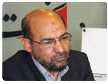
شورای اسلامی شهر بی تقصیر در گرانی