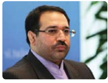
حضور در شهرستانها مایه امید است