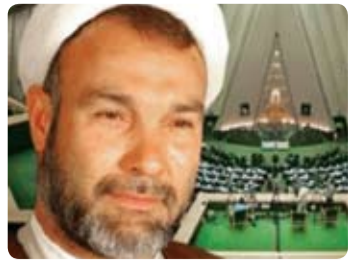
راهکارهای تحقق جهاد اقتصادی

نگاهی به توسعه حمل و نقل عمومی سیاسی نیست صفحه ۲ قابلیات: یک مقام مسئول: آمار زندانیان مهریه و چک برگشتی در حال افزایش است صفحه ۴ آقای استاندار جواب هواداران ابو مسلم را بدهید! صفحه ۷