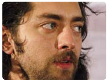
قسم خوردند معنادار!